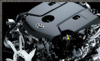
Motor a diesel 204 cv