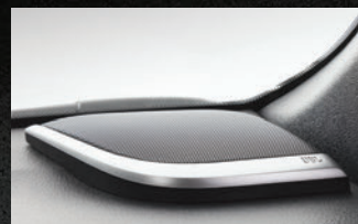
Sistema de som JBL 10.1