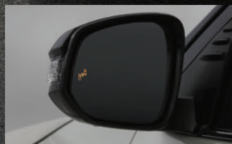
Sistema de alerta de ponto cego (BSM)